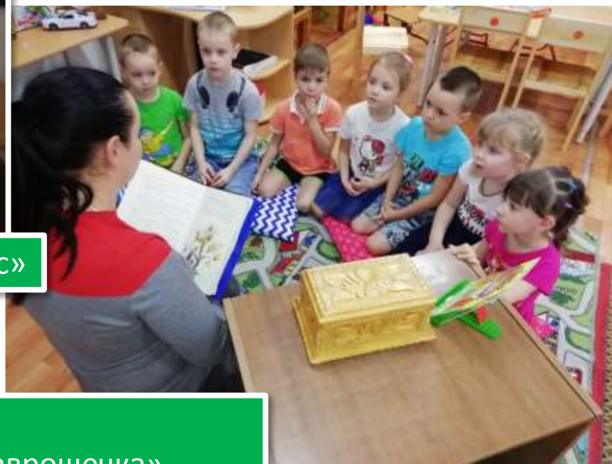
НОД по Развитию речи (чтение русской народной сказки )«Хаврошечка»