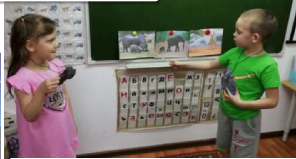
НОД по развитию речи Составление рассказа