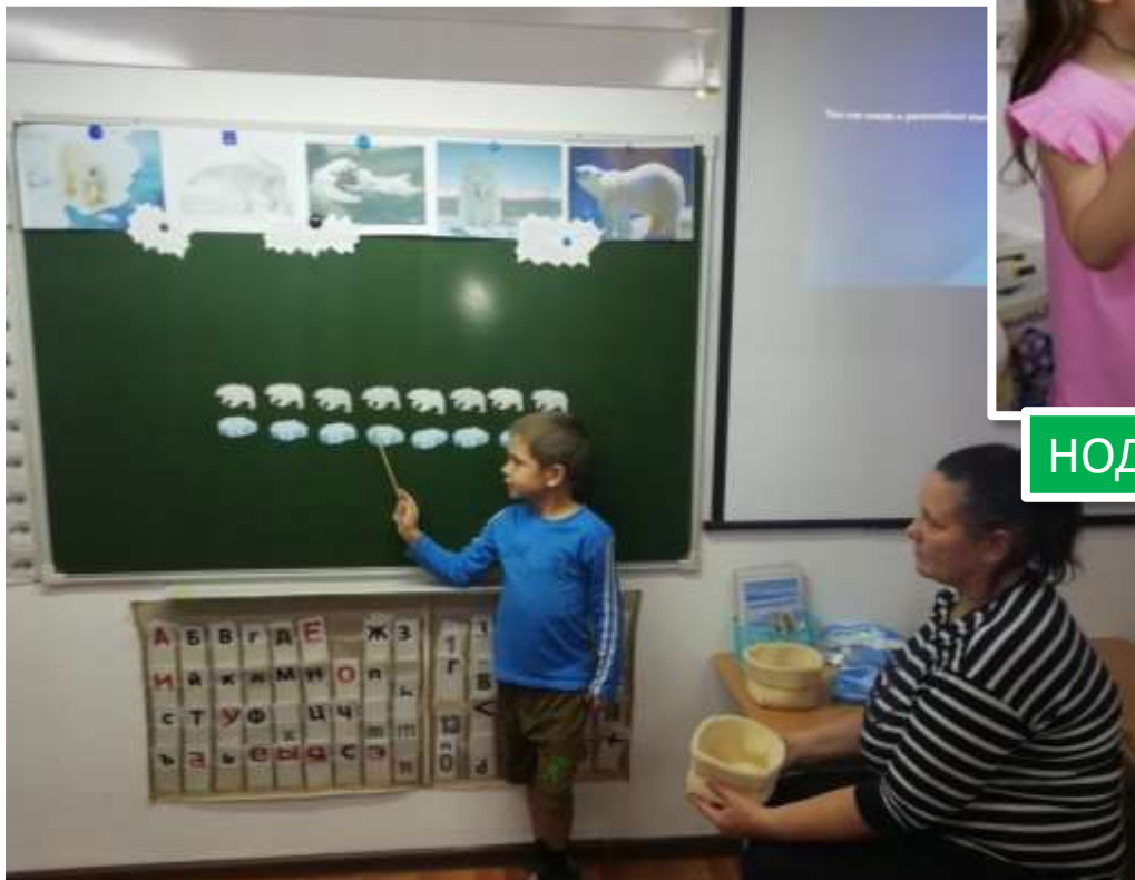
НОД по ФЭМП «Путешествие на Северный полюс»